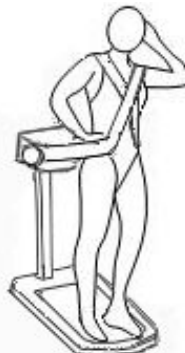
Массаж грудной клетки