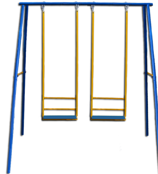
Детский спортивный комплекс