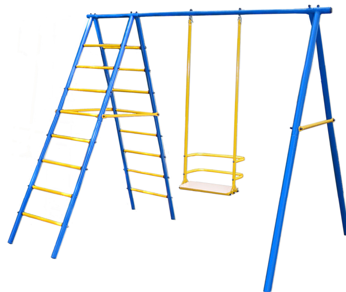
Детский спортивный комплекс